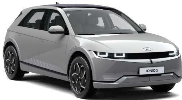
CIBER GRIS METALIZADO