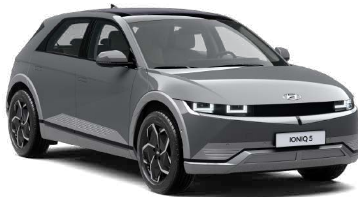
GRIS ECO PERLADO