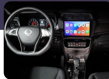
Centro de entretenimiento de 10" con CarPlay y Android Auto