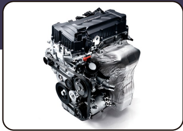
Motor 1.6L 126 HP y 160 NM