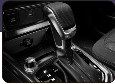
Dirección y caja inteligente con 3 modos de manejo: Normal, Sport y Winter (Versión AT)