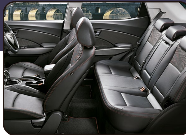
La más cómoda y amplia de su segmento