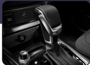
Dirección y caja inteligente con 3 modos de manejo: Normal, Sport y Winter