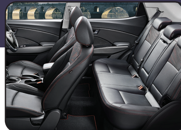
La más amplia y cómoda de su segmento