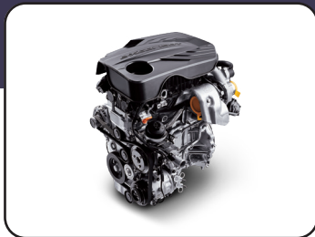
Motor 1.6L a gasolina 126 HP y 160 NM