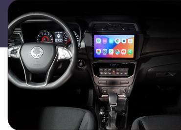
Centro de entretenimiento de 10" con CarPlay y Android Auto