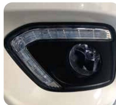
Luz día LED (DRL) y exploradora halógena con amplio haz de luz la cual permite una conducción más segura