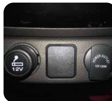
Encendedor de cigarro y toma de poder adicional de 12V