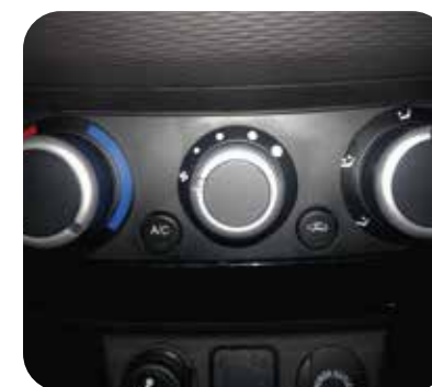
Aire acondicionado análogo