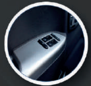
*Imágenes de referencia ilustrativas